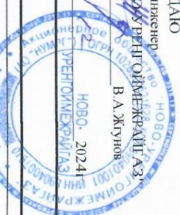
График технического обслуживания ВЛГО, ВКГО МЖФ на 4 квартал 2025 года