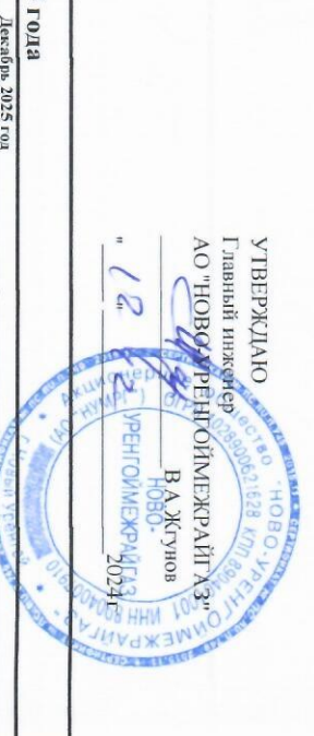
График технического обслуживания ВДГО, ВКГО МЖФ на 4 квартал 2025 года