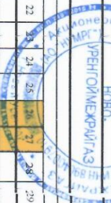
График технического обслуживания ВД О, ВКТО, МКФФ на 2 квартал 2025 года