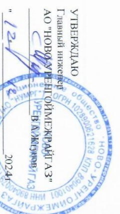
График технического обслуживания ВДГО, ВКГО МЖФ на 3 квартал 2025 года